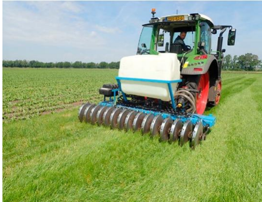
Kunstmestvervangers / urine